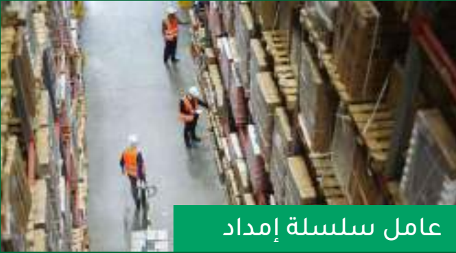
عامل سلسلة إمداد